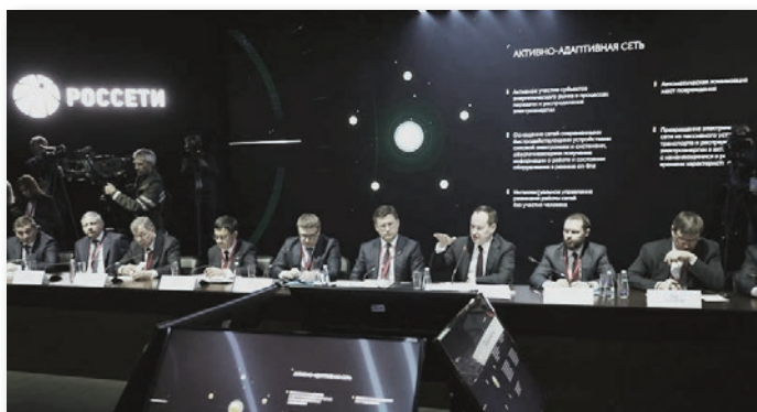
Участие в РИФ-2019 (Сочи)

Энергетики филиала «Пермэнерго» завершили реконструкцию распределителей 0,4–10 кВ (п. Сергеевский)